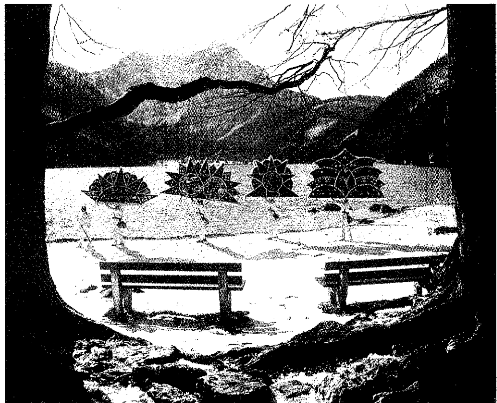
Glöckler am Vorderen Langbathsee.

Rieder, Walter, Reinhard Hörmandinger: „A Stegga, a weiß Gwand, a Kappm und Glock'n!“, Verl. Denkmayr o. O. 2000.